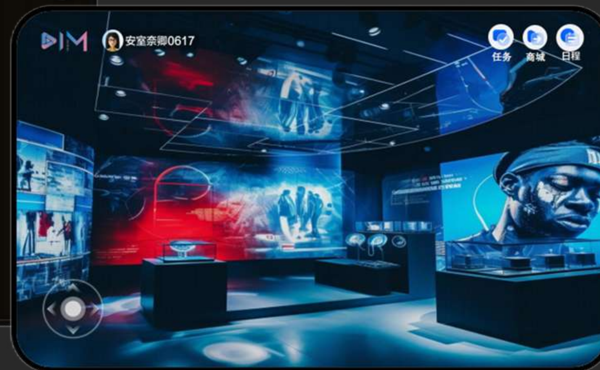
歌星藝人及表演者博物館