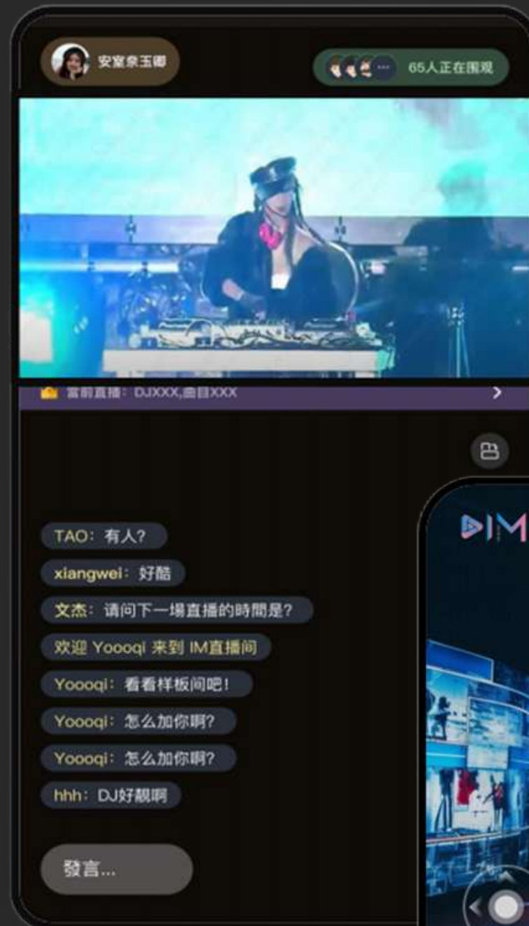
直播活動其中介面