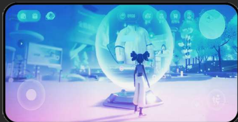
個人大廳 - 可檢視個人成就、積分禮品換領、更換裝束、參加活動紀錄等